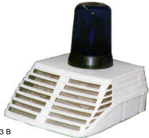
WA - 3 B