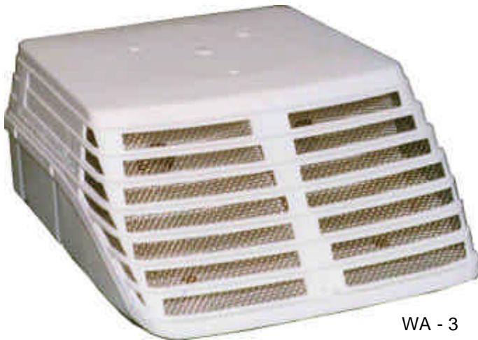
WA - 3